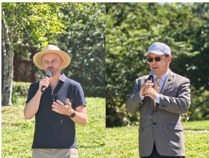
图：左为巴尔部长，右为肖千大使

12月7日，中国驻澳大利亚大使馆肖千大使，出席北京堪培拉结为友好城市25周年庆祝活动。该活动由堪培拉北京花园之友主办，澳大利亚中国工商业委员会承办。澳大利亚首都领地首席部长巴尔、澳中友协首都领