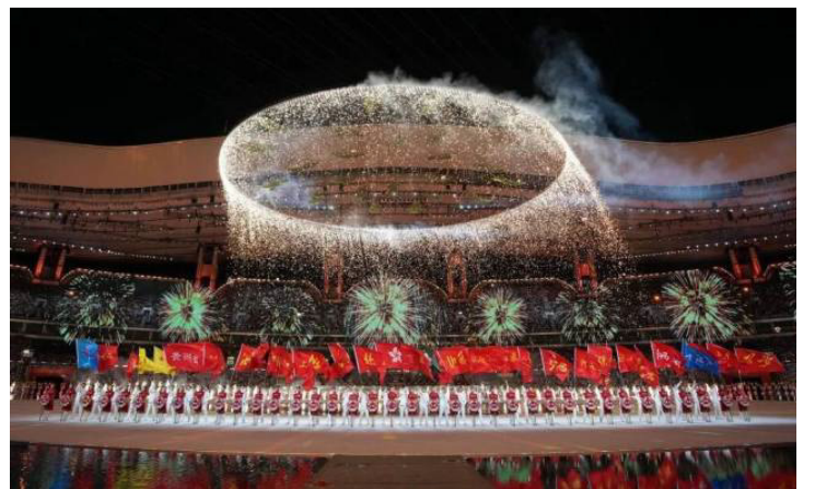
开幕式现场。

卷。在这场展现“国际水准、中国气派、岭南风韵、湾区魅力”的开幕式上，众多江门元素惊艳亮相。从铿锵有力的醒狮表演到刚柔并济的咏春武术，从韵味悠长的粤剧艺术到江门籍明星刘德华的压轴登场，侨乡文化的多元魅力在这场全国瞩目的体育文化盛会上绽放异彩。