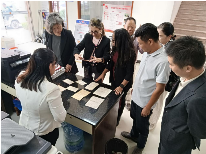
图为古巴国际电视台记者在拍摄新会古巴家书