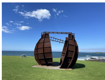
象征着“胜利”（V字型）的纪念碑矗立在伍伦贡市肯布拉港口，见证着中澳这段跨越时空的正义情谊

这场罢工一坚持就是72天。工人们顶着政府施压和失业风险，最终迫使澳大利亚政府全面终止对日生铁出口，却也导致数千同胞失业、必和必拓钢铁厂倒闭。2025年11月，中澳各界还在当地为这一事件举办了87周年纪念活动，中国驻悉尼总领事王愚感慨：“这充分展现了澳大利亚民众对中国人民的深厚情谊”。