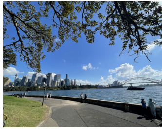
澳大利亚海军二战后曾拥有3艘航母，在此后的50-70年代一直保持着双航母的傲人规模。图为澳航母母港之一的悉尼港远眺

当“辽宁舰”“山东舰”游弋大洋时，很少有人会想到，中国航母梦的起点，是一艘来自澳大利亚的旧航母——“墨尔本”号。1984年，中国以3000万澳元的价格，从澳大利亚购入了这艘看似“破旧”的航母，它也成为中国引进的第一艘航母。