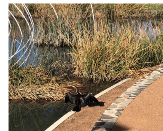
1986年联合签署了《保护候鸟及其栖息环境的协定》，在共同保护迁徙候鸟及其栖息地方面进行了卓有成效的合作。图为堪培拉南部杰拉伯姆拉湿地自然保护区的一只蛇鹈，正展开双翅晾晒羽毛

除了这些“大事件”，澳大利亚在南极科考、飞行员培训、鸟类保护等领域，都与中国保持着紧密合作。