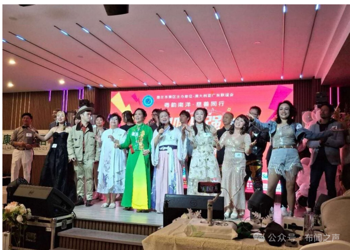
图为全部参赛选手

澳华通社墨尔本讯：南腔粤调，雅乐清音。「粤韵南洋·慈善同行」2025年「粤唱粤强」华人粤语歌唱大赛南太平洋墨尔本赛区总决赛暨颁奖典礼，11月9日晚在史宾威华人区圆满落幕。澳中社会各界嘉宾粤语歌曲爱好者300多人济济一堂赏美食，听歌评