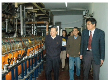
2004年2月27日，陈和生（右一）陪同杨振宁（左一）参观北京正负电子对撞机直线隧道

“我想，杨先生对世界物理学的贡献、对中国科技发展的推动、对中国人才培养的付出，会永远载入史册。”停顿许久后，陈和生接着说道。