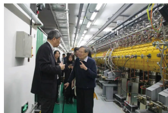
2019年2月19日，陈和生（左一）陪同杨振宁（右一）在东莞参观中国散裂中子源直线隧道

这样充满活力、头脑清楚、思维敏捷。他对过去事情的记忆非常清晰，说话几乎没有口误，也不似有些上年纪的人不会不断复述同一件事。