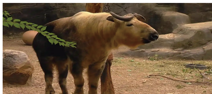
成群较温和,独牛最危险

正是由它们造成的。过去,我国森林里虎的数量众多,特别是华南虎,分布极广。作为顶级捕食者,老虎能有效控制森林里大型有蹄类动物的数量。然而上世纪50年代以后,野生虎数量锐减,华南虎更是在野外绝迹。尽管豹类部分填补了空缺,但面对羚牛这样体格强壮的动物,依然难以压制。因此在没有老虎的森林里,羚牛逐渐成为无可争议的霸主,成年后几乎没有天敌。