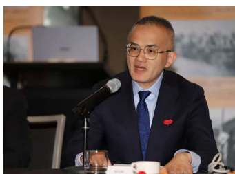
蔡志峰公参讲话。

蔡公参在讲话中讲述了纪念中国人民抗日战争暨世界反法西斯战争胜利80周年的重要意义。他说,抗日战争是中华儿女众志成城、共御外侮的民族自卫战,更是中国人民为维护世界和平和安全作出的最大努力。它代表着人类的正义力量,以人类历史上前所未有的艰苦卓绝抗击法西斯侵略者。我们通过纪念活动让大家以史为鉴,珍爱和平。蔡志峰希望广大华人华侨要团结一致,发扬抗日战争的伟大精神,为世界未来的和平与祖国的繁荣发展贡献力量。