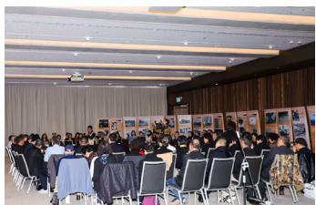
座谈会会场。

来自堪培拉、悉尼、墨尔本的华人社团侨领、有关专家学者,日军侵华暴行的亲历者,二战老兵与伪满州国的后代、华人华侨代表等近百人参加了座谈会。