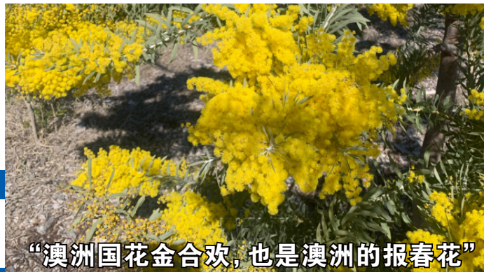
“澳洲国花金合欢，也是澳洲的报春花”

中华之声报社出版 2025年9月5日 星期五 第8期 总第008期 本期6版 网址: www.accpublishing.com.au 邮箱: wenchen.canberra@gmail.com