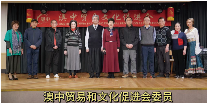
澳中贸易和文化促进会委员