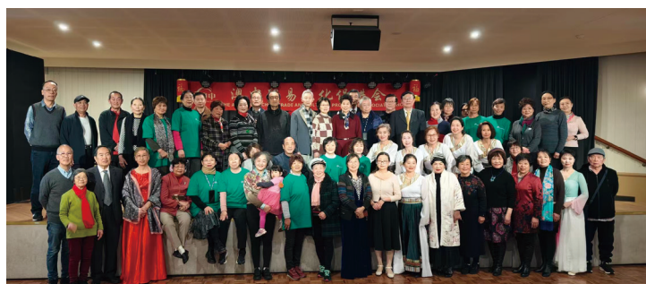
图为：参加茶话会的部分会员合影

未来，我们将继续坚持开放包容的理念，扩大合作范围，深化交流内容，让澳中两国的合作与友谊不断发展壮大，共同书写和平、繁荣的美好篇章，为推动中澳关系的友好与和平贡献力量。