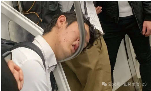
我忽然想起上海的弄堂,

他端着咖啡的手在微微颤抖,眼神空洞得像秋天的玻璃窗。旁边的女孩子化着精致的妆容,却在偷偷擦眼泪。