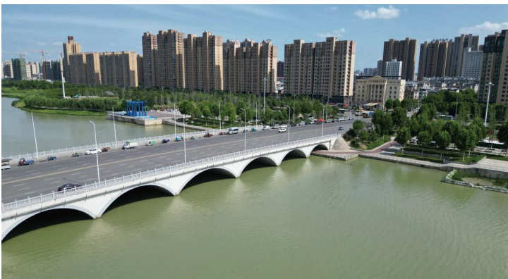
城市更“新”：荒郊锈带复现千亩水域

6月18日，湖北省天门市华侨风情馆揭牌，标志着中国内陆首个华侨主题展馆进入内部布展阶段。红色榫卯式馆顶之畔，更新建设的千亩北湖公园倒影点点，加上新晋“顶流”地标导入的客流汇集成消闲夜市，在中国“直播”潮流和县域“小众”旅游热度的叠加放大中，中国内陆最大的侨乡——天门通过手机小屏幕的硬连通，正在与“大世界”、侨胞群体软互动，成为海内外了解中国的“门户”。 “很难想象，5、6年的时间，天门北湖这一带能变得这么好，成为新城的‘天花板’。”从武汉周末